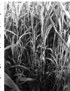
Excellent développement de la luzerne sous l'Herbe de Soudan.

Grâce à son rendement fourrager élevé et à sa contribution pour un meilleur établissement de la luzerne, l'herbe du Soudan est une excellente plante de compagnonnage selon M Michaud. (voir photo). Il faut toutefois prendre en considération le type de variété, car ils ne sont pas tous équivalents. Par ailleurs, des alternatives à la fléole des prés sont la fétuque élevée dans des sols plus argileux alors, que le dactyle est à préconiser dans des sols plus sablonneux.