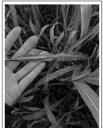
Dessèchement de l'herbe du Soudan ( Sudangrass Soudan ).

Quant à l'essai réalisé au Lac-Saint-Jean, le producteur laitier a semé sur un retour de prairie de l'herbe du Soudan ( Sudangrass Soudan ) et du trèfle d'Alexandrie qui a été ensilé par la suite. Deux coupes ont été récoltées et la qualité a été moyenne (> 60 % NDF). À la mi-août, il était possible d'observer du dessèchement sur l'herbe du Soudan (voir photo) et le trèfle d'Alexandrie était très peu présent. Pour l'année 2021, des choix différents pour le mélange ont été faits à la suite des observations de l'été 2020. Le trèfle d'Alexandrie a été remplacé par du trèfle rouge et une autre variété d'herbe du Soudan plus résistante ( Nutri-King BMR ) au dessèchement a été choisi. Les résultats de cet essai sont à venir. ■